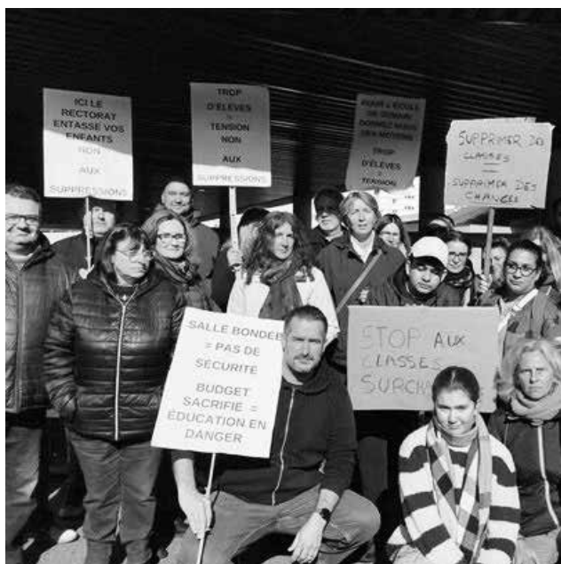
Au collège de Capeyron, à Mérignac, contre la fermeture de deux classes

L'argument ne vaut rien dans une école qui manque de tout. Comme nous l'avons fait clairement entendre la baisse démographique doit permettre de réduire les effectifs, c'est la première étape pour relancer une éducation digne de ce nom. Les raisons de la colère se multiplient, comme le montrent les mobilisations sur Marseille, en région parisienne, celles ici contre la casse de l'organisation du travail des remplaçants dans le 1 er degré (voir Anticapitalistes n°136), celles des AESH, des AED... Une colère que nous souhaitons voir éclater après les vacances de printemps, en convergeant dans un vaste tous ensemble.