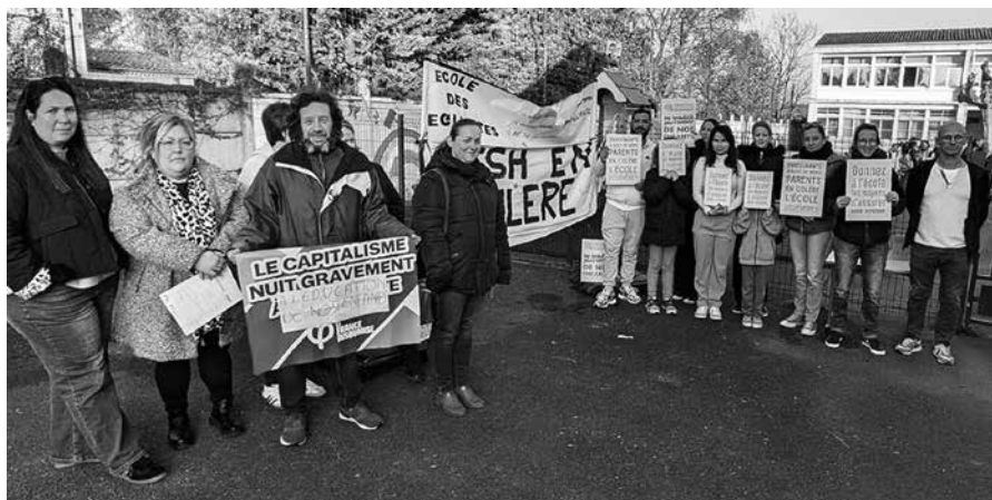
Devant l'école des Eglisottes, contre la fermeture d'une classe

En Gironde, une saignée sans précédent dans les effectifs était programmée par la direction départementale de l'éducation (DSDEN) : 148 fermetures de classes dans les écoles maternelles et primaires, ainsi que 42 suppressions de postes dans le 1er degré, 28 postes supprimés dans les collèges et lycées, et 29 postes de profs sont détournés pour financer les « pôles d'appui à la scolarité », c'est-à-dire retirés de leur fonction d'enseignement pour la gestion des affectations des AESH auprès des enfants. Il s'agit de l'application du budget d'austérité de Lecornu qui prévoit 4018 suppressions de postes à l'échelle nationale.